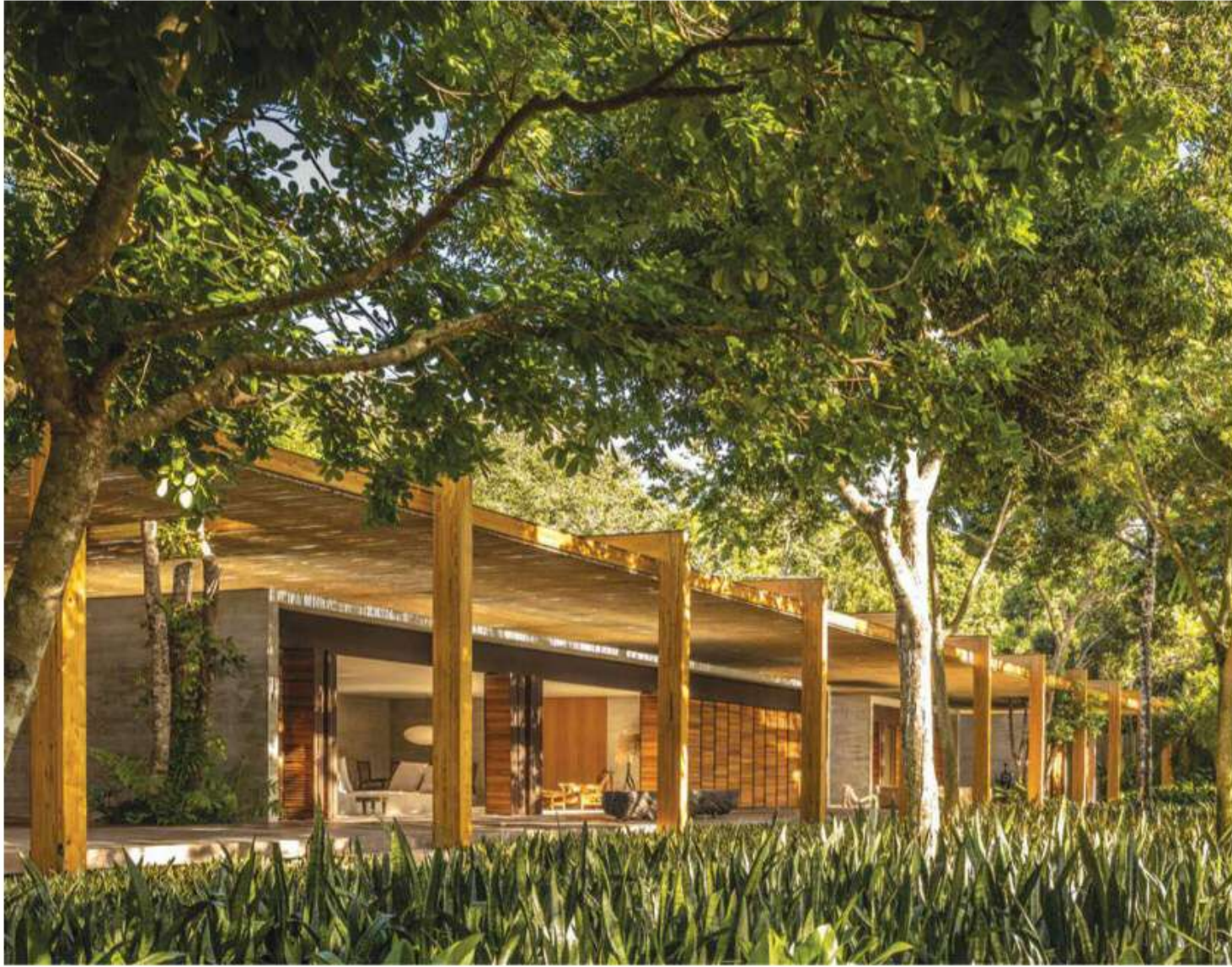
La terraza rectangular, que es abrazada por la abundante vegetación, fue cubierta con una pérgola de eucalipto soportada por 14 marcos de madera.