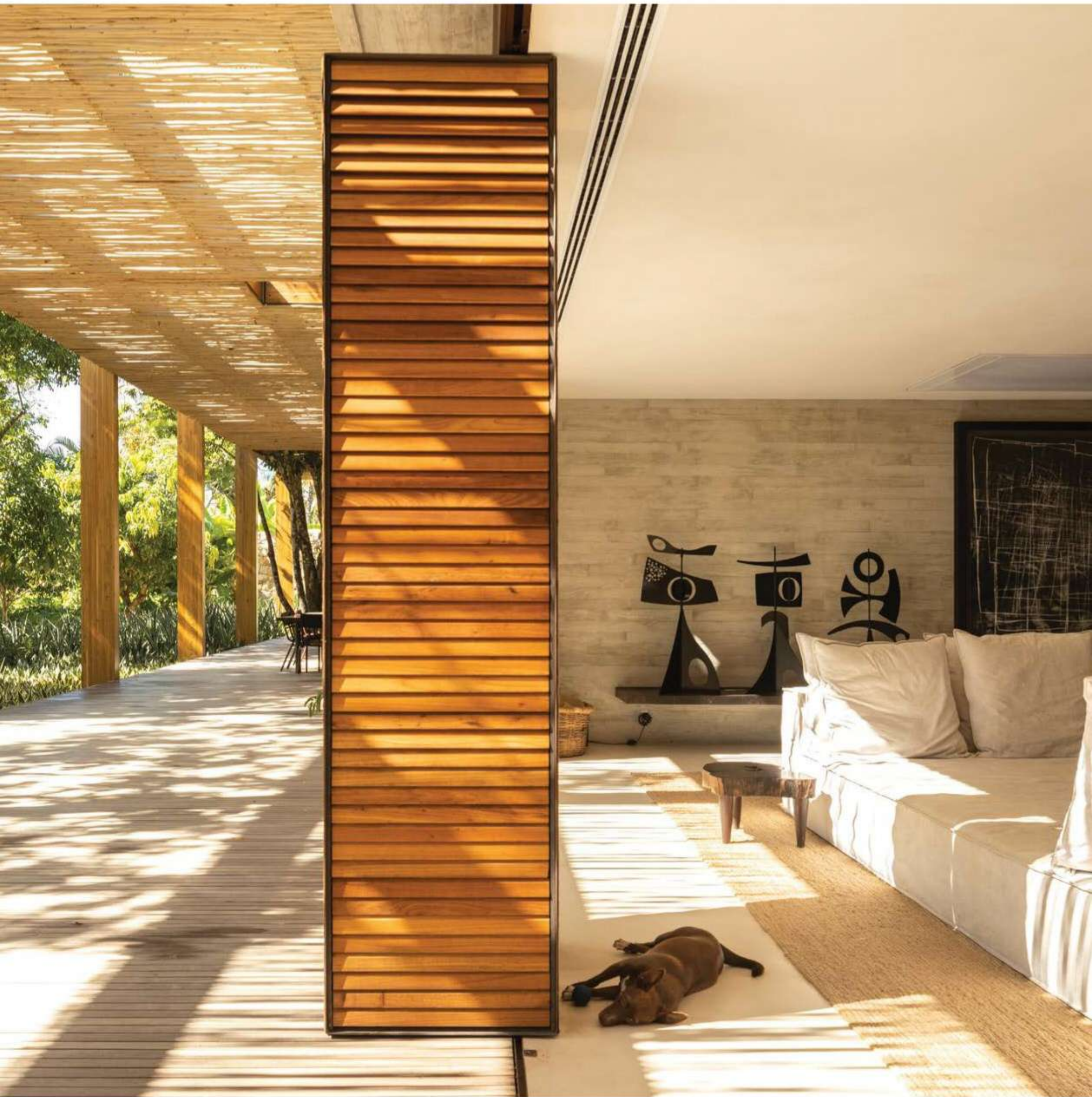
La relación permanente entre interior y exterior caracteriza este proyecto situado en Trancoso, Brasil.